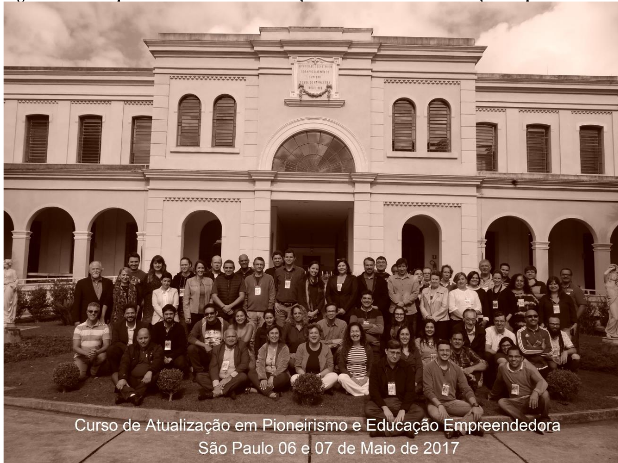
Figura 1 – Participantes do Curso de Atualização em Pioneirismo e Educação Empreendedora

A etapa presencial foi o primeiro módulo do curso, com duração de 15 horas. As sessões do módulo presencial aconteceram nos dias 6 e 7 de maio (sábado e domingo) de 2017 das 09h00 às 18h00 no Museu da Imigração do Estado de São Paulo.